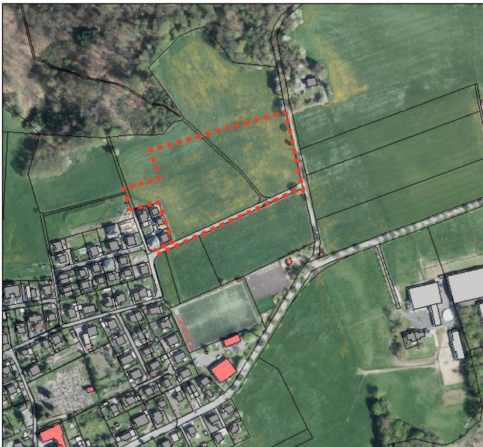
Abb. 1: Plangebiet, o.M. (Orthophoto, ABK @Geobasis NRW)

Das Plangebiet ist in Abbildung 1 dargestellt. Abbildung 2 zeigt die Planzeichnung der geplanten Bebauungsplanänderung.