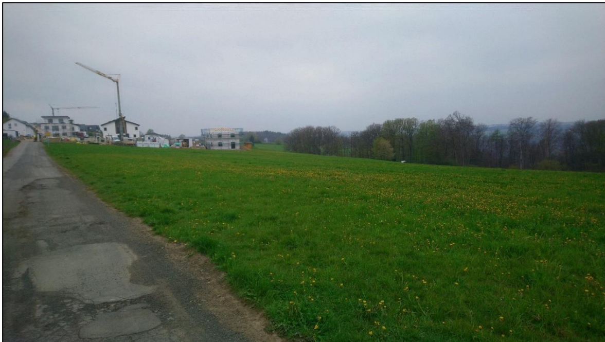
Abb. 3: Blick von Südosten auf das Vorhabengebiet

Der Waldbestand ist im Nahbereich des Plangebietes als FFH- und Naturschutzgebiet ausgewiesen. Ca. 300 m südöstlich befinden sich Biotopkataster- und -verbundflächen.