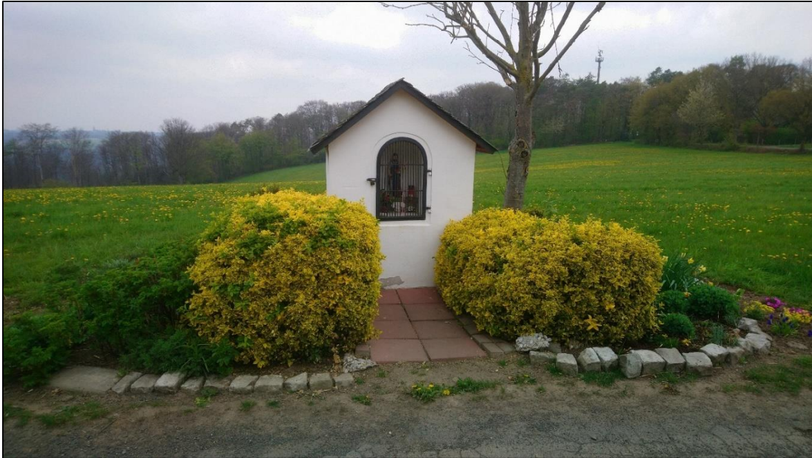
Abb. 4: Bilderstock

Das Plangebiet enthält Biototypen von sehr geringer bis mittlerer ökologischer Bedeutung. Die Wiese bietet geeignete Nahrungshabitate für planungsrelevante Arten. Es befinden sich wenige Bäume mittleren Baumalters direkt angrenzend am Plangebiet, die aber erhalten werden. Die Asphaltstraße ist nur von sehr geringer Bedeutung.